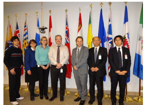
カナダ食料農業省での調査の一コマ