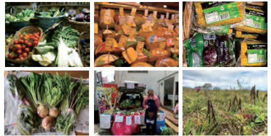
国内外のオーガニック市場・産地の調査