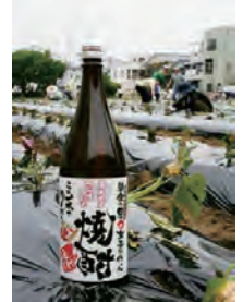
都市農地を守るファームマイレージ 2 商品