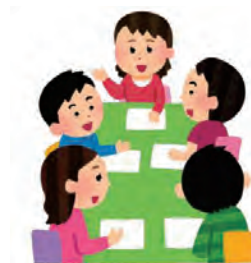
アクティブ・ラーニング