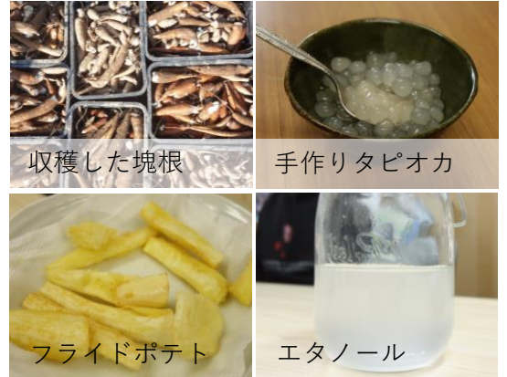
多様なキャッサバの利用法

海外の生産現場で生じている問題に対し、現地と日本の双方で取り組み、課題解決と人的交流に貢献します。