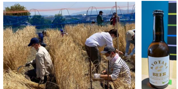
ゴールでメロン大麦の栽培と試作品のクラフトビール