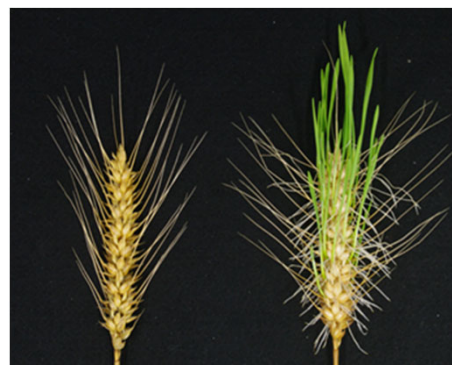
ゲノム編集でコムギ発芽を改変

国公立および民間の育種事業に利用可能な、高能率の育種技術を提供し、事業の高度化に貢献します。