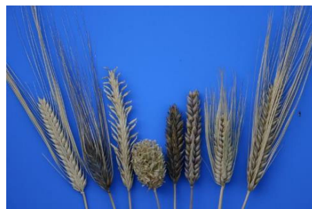
オオムギ遺伝資源の多様性