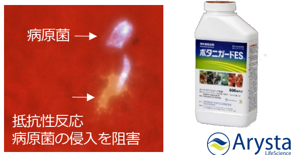
図3. 昆虫寄生菌が植物の抵抗性を誘導することを解明し、微生物農薬として応用