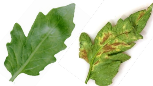
図1. 葉かび病菌は本来、抵抗性品種に感染できないが(左)、感染できる系統(右)が多数発生

【農業団体との連携】野菜類の疾病診断や、防除法の提案など地域振興にも取り組んでいます。