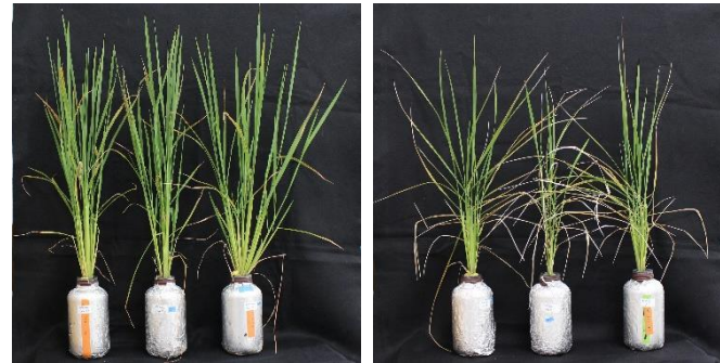
通常リン酸施肥時のイネの生育(左)とリン酸毒性発症時のイネの生育(右)の比較