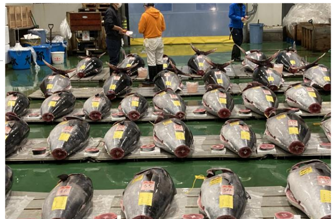
写真上：電鉄系食品SMの水産売場(神奈川・川崎市) 写真下：豊洲市場のマグロのセリ場(東京・江東区)